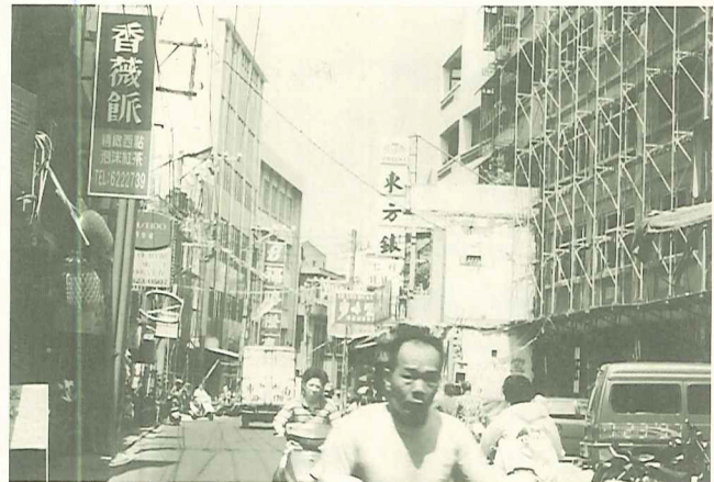
淡水中正路的造街已刻不容緩

籌劃經年，被文化界視為「社區總體營造」最佳典範的〈新港奉天宮廟口造街案〉，在日前舉行的一場住戶公民投票中，慘遭否決而失敗，一時震驚了許多關懷社運的熱心人士。