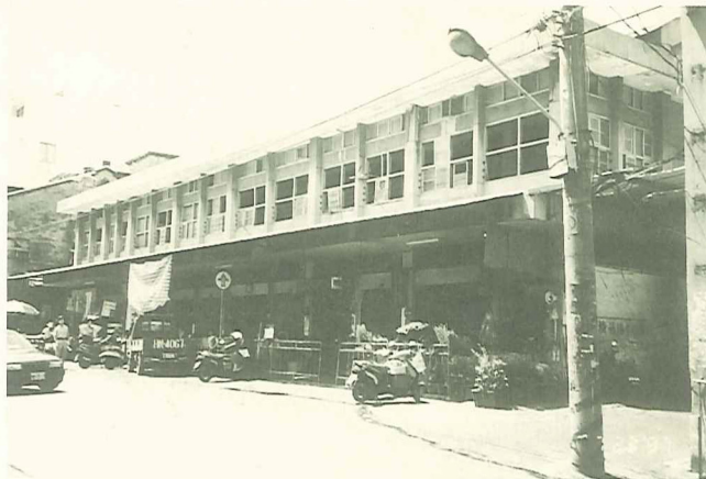
福佑宮因廟房產權糾紛，造廟不成

目前淡水中正路也正在進行造街的計劃，新港的失敗經驗會不會一演再演？確實是自治協進會的