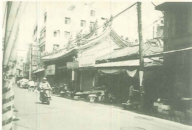
市場產權不清，老街造景不成

尤其，我們可以感受到淡水捷運通車後，以休閒、觀光爲號召的產業，正猛烈衝擊著中正路原有的傳統產業，一向傳統產業的商號棄守，淡水老街恐怕難逃一番天翻地覆的大變化！