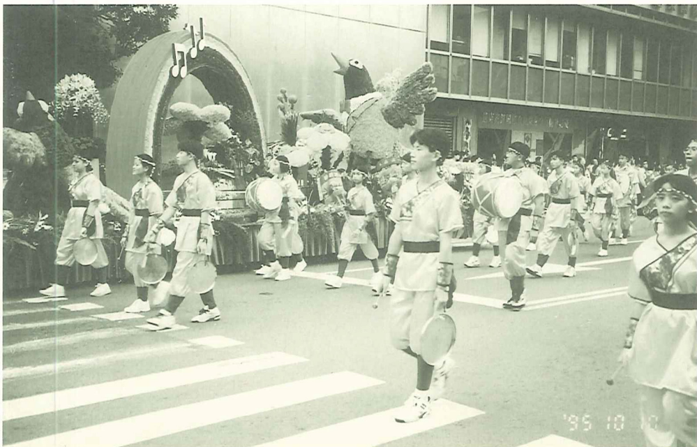
淡水工商跳鼓隊常配合民間演出

跳鼓是一項簡單的活動，器材、服裝的經費都不高，是值得推展的民俗活動，在全省（尤其是中南部）許多國中小都有成立隊伍，惟北部地區甚少學校推廣，殊為可惜。淡水工商跳鼓隊只是一顆種子，願這顆種子能帶動起民俗活動的蓬勃發展，繼而發跡到北臺灣的每一個角落。